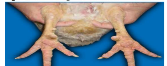
Tråputer skal være glatte og fine. Ikke ha sår.