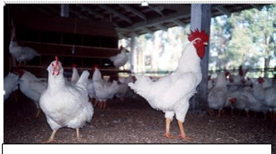
Hanene skal være langstrakt.