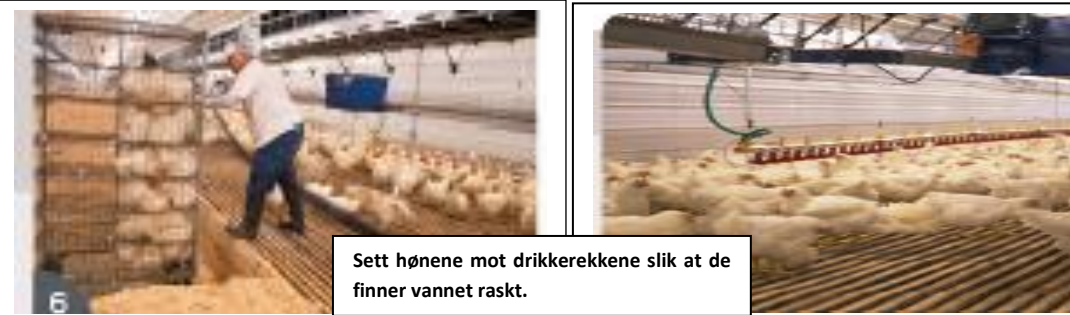
Sett hønene mot drikkerne slik at de finner vannet raskt.

De hønene du setter inn, settes ved en drikkenippelrekke. Følg med på fôr- og vannopptak de tre-fire første dagene etter innsett. Om nødvendig, flytt dyr mot vann-nipler og øk trykket på vannrekkene. Ha vannrekkene lavt slik at dyra kan se vanndråpen på niplene. Det er viktig at ingen dyr taper i vannopptak. Dersom det er mange tapere i starten, må lysopptrapping utsettes.