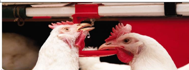
Nippel skal være i øyehøyde.