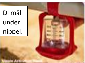
DI mål under nippel.