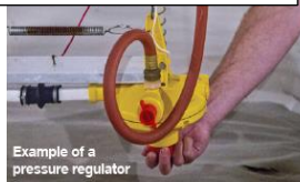
Example of a pressure regulator